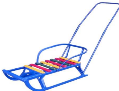
Санки детские с толкателем