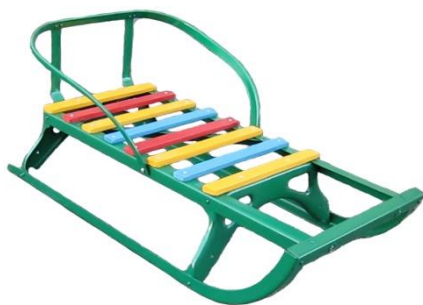
Санки детские со съёмной спинкой